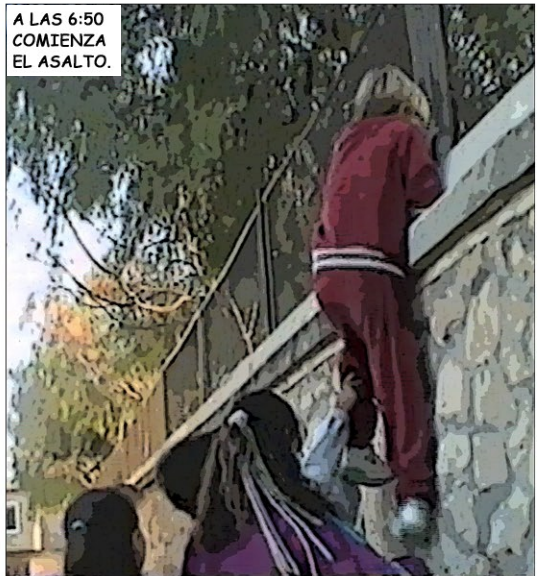
A LAS 6:50 COMIENZA EL ASALTO.