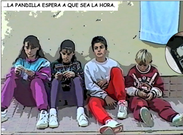
...LA PANDILLA ESPERA A QUE SEA LA HORA.