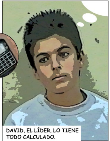
DAVID, EL LÍDER, LO TIENE TODO CALCULADO.