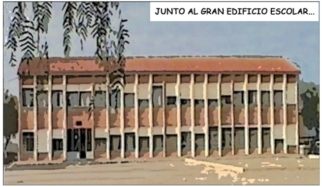
JUNTO AL GRAN EDIFICIO ESCOLAR...