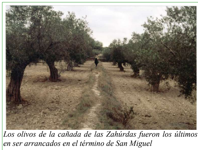
Los olivos de la cañada de las Zahúrdas fueron los últimos en ser arrancados en el término de San Miguel

hasta la década de los treinta del siglo pasado. Al ser un árbol poco exigente ha colonizado los más diversos territorios; incluso entre los pinos se pueden encontrar ejemplares aislados sobre diminutos aterrazamientos individuales con trenque de piedra. La utilización de tractores desde finales de los 50 –en 1960 habían 7 tractores en San Miguel 5 – hizo desaparecer las bestias y con ellas la necesidad de su cultivo. Actualmente las transformaciones en regadío de las tierras que ocupaban, la construcción de urbanizaciones y su arranque para utilizarlos como árboles ornamentales en parques, jardines y rotondas los han reducido a unas pequeñas manchas como mudos y amenazados testigos del esplendor pasado.