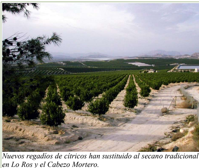
Nuevos regadíos de cítricos han sustituido al secano tradicional en Lo Ros y el Cabezo Mortero.