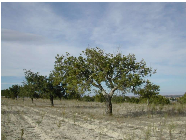
Plantación de algarrobos al este de la antigua fábrica de yeso