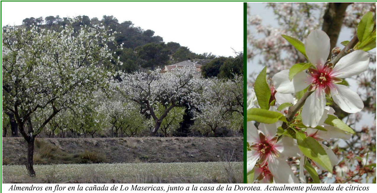
Almendros en flor en la cañada de Lo Masericas, junto a la casa de la Dorotea. Actualmente plantada de cítricos

Actualmente es un cultivo en decadencia, quedando unas pocas manchas residuales que poco a poco van cediendo ante los nuevos regadíos: cítricos y hortalizas.