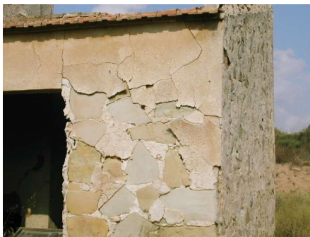
Losa en tabique en dependencia secundaria. Casa de la Tía Manzana.