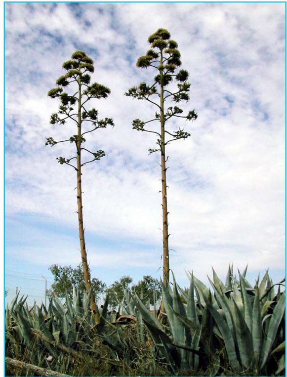
Alsabarones: tallos florales de la "pitera" (Agave americana), utilizados para vigas de sostén

Otro rasgo común de la arquitectura popular, independientemente de la superficie o volumetría, es el carácter espontaneista de las construcciones que a partir de unas dependencias centrales van creciendo en función de las necesidades domésticas, tanto de las propias familias como de los elementos ligados a la economía familiar: cuadras, gallineros, almacenes, etc.. Suelen ser construcciones sencillas con economía de medios pero de una enorme solidez. Este crecimiento espontáneo, en función de las nuevas necesidades, ha ido conformando una tipología peculiar que caracteriza la vivienda del medio rural.