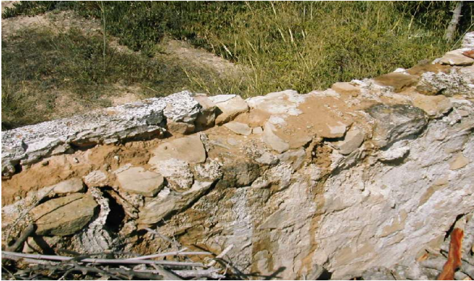
Piedra, yeso y tierra colorá en un muro de cochinerá. Casa Dorotea.