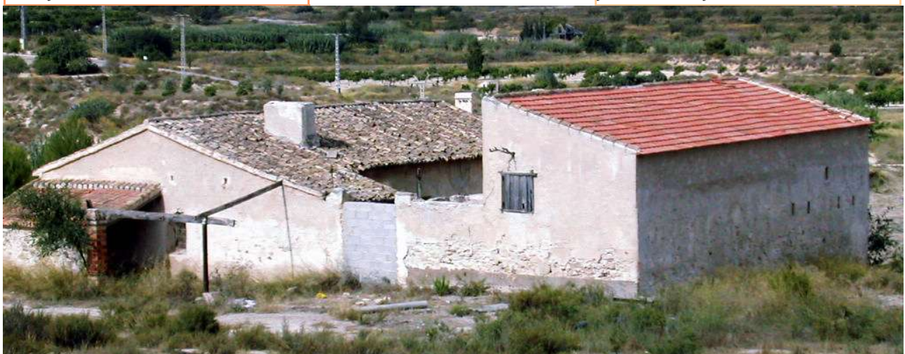
Teja redonda y plana en la casa de Lo Carrasco