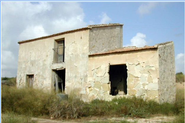
Casa de la Manzana