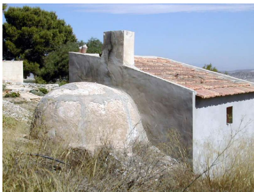
Horno con caseta. Casa Dorotea