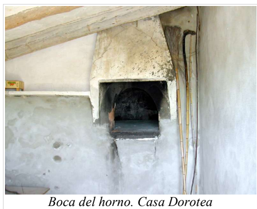
Boca del horno. Casa Dorotea

Otro elemento común es el horno moruno para hacer pan, cuyo suelo acostumbra a ser de losa de piedra arenisca blanda y la bóveda de adobe o piedra enfoscado con una mezcla de yeso y tierra colorada. Indisolublemente unido al horno está la garbera de la imprescindible leña con la que caldearlo, refugio a su vez de pollos y gallinas.