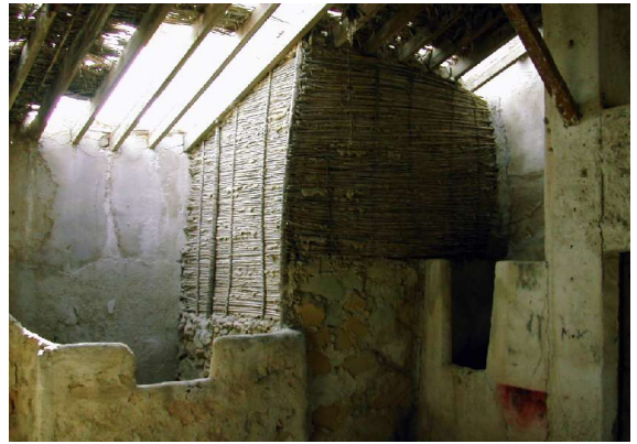
Tabique de cañizo enlucido por el interior. Lo Zafra