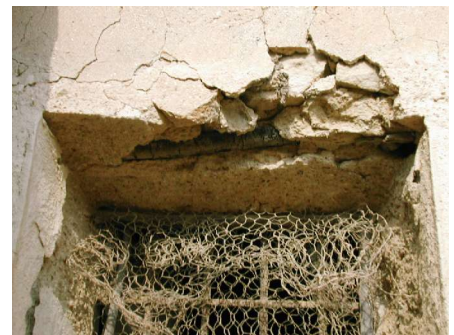
Rama de pino sujeta el dintel de la ventana. Lo Carrasco.