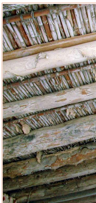
Colañas de alsabarón, pino y maderos sujetan el manto de cañas. Lo Carrasco