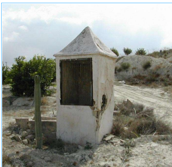
Aljibe de tinaja. Lo Maseras

recientes o humildes tienen varios puntos en común. Uno es el imprescindible aljibe que suministra el agua necesaria para cubrir las necesidades de personas y animales –algunas de ellas lo complementan con un pozo: Las Zahurdas, Lo Balaguer, La Escribana, La Castellana, El Prado siempre a orillas de ramblas o zonas deprimidas donde el nivel freático no está muy hondo–. Estos aljibes, bien de tipo tinaja, bien abovedados recogerán el agua en unos casos de las únicas aportaciones de los tejados y en otros de las avenidas superficiales aprovechando las pendientes del terreno, conduciéndola mediante motas convenientemente dispuestas.