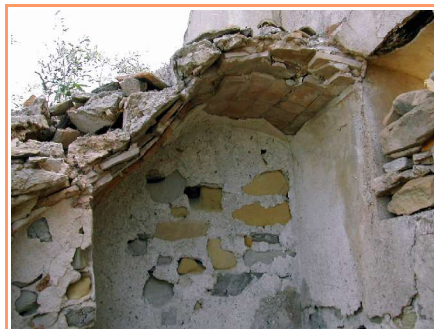
Ladrillo de barro en bóveda de escalera. Los Infantes