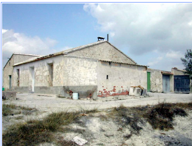
El Canto del Gallo