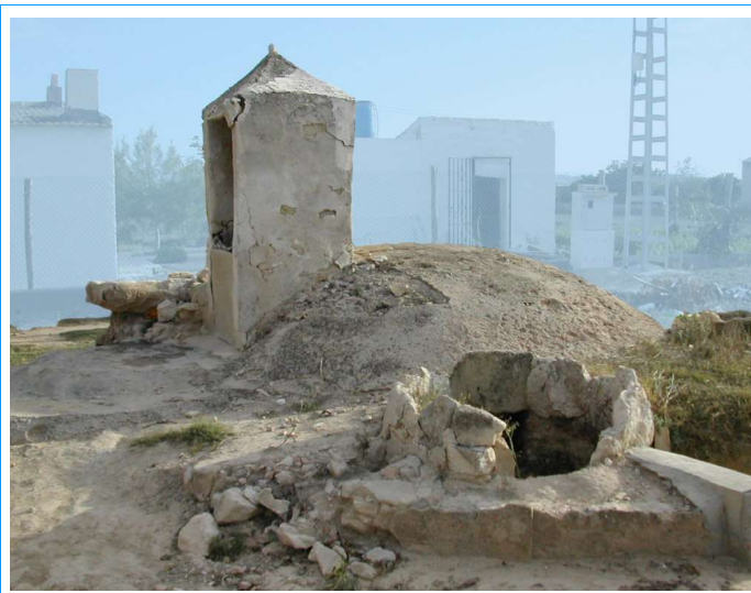
Aljibe de bóveda semiesférica, con recibidor. Los manchaos