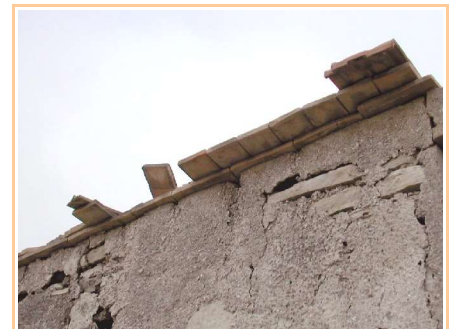
Con el yeso molido a rulo se enlucé la fachada. Los Infantes