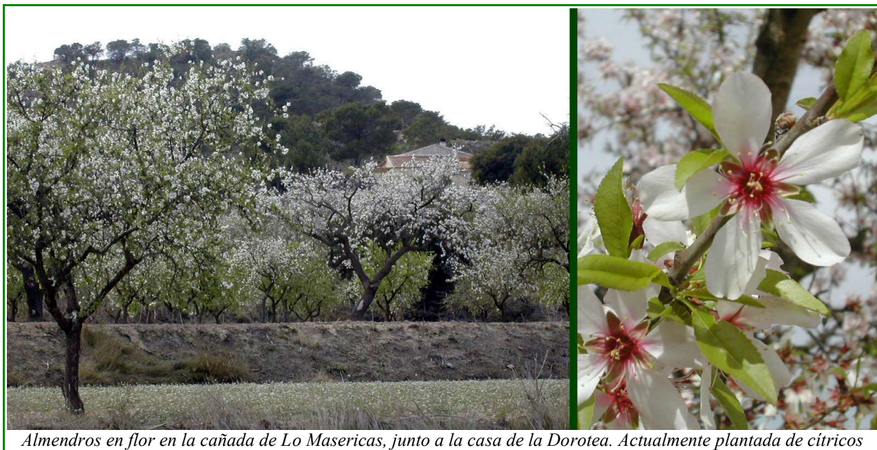
Almendros en flor en la cañada de Lo Masericas, junto a la casa de la Dorotea. Actualmente plantada de cítricos

Actualmente es un cultivo en decadencia, quedando unas pocas manchas residuales que poco a poco van cediendo ante los nuevos regadíos: cítricos y hortalizas.