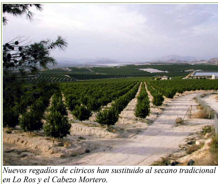
Nuevos regadíos de cítricos han sustituido al secano tradicional en Lo Ros y el Cabezo Mortero.