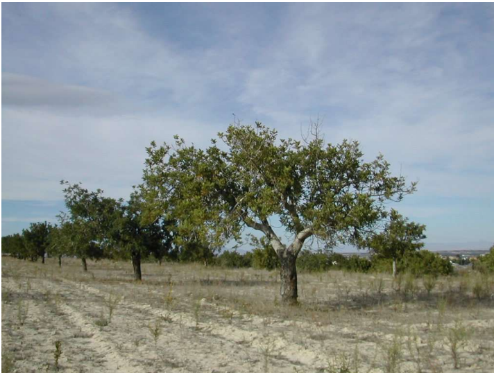
Plantación de algarrobos al este de la antigua fábrica de yeso