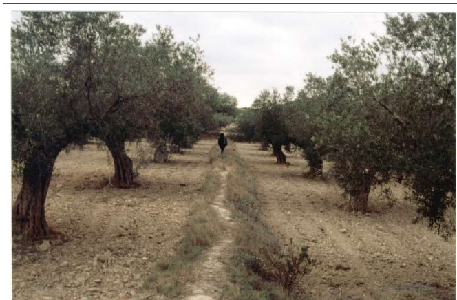
Los olivos de la cañada de las Zahúrdas fueron los últimos en ser arrancados en el término de San Miguel

hasta la década de los treinta del siglo pasado. Al ser un árbol poco exigente ha colonizado los más diversos territorios; incluso entre los pinos se pueden encontrar ejemplares aislados sobre diminutos aterrazamientos individuales con trenque de piedra. La utilización de tractores desde finales de los 50 –en 1960 habían 7 tractores en San Miguel 5 – hizo desaparecer las bestias y con ellas la necesidad de su cultivo. Actualmente las transformaciones en regadío de las tierras que ocupaban, la construcción de urbanizaciones y su arranque para utilizarlos como árboles ornamentales en parques, jardines y rotondas los han reducido a unas pequeñas manchas como mudos y amenazados testigos del esplendor pasado.